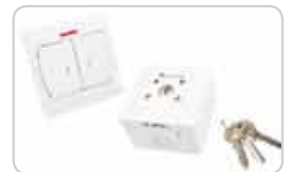
Wipp- und Schlüsselschalter