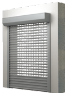
BKR / SK