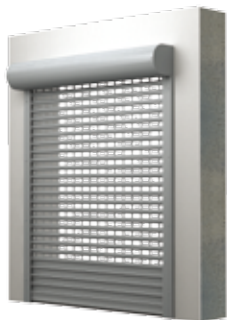
BKR / SKO-P