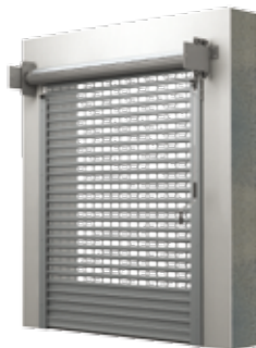
BKR / KNB