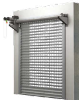
BKR / KNS