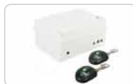
Zentralen mit Funksendern